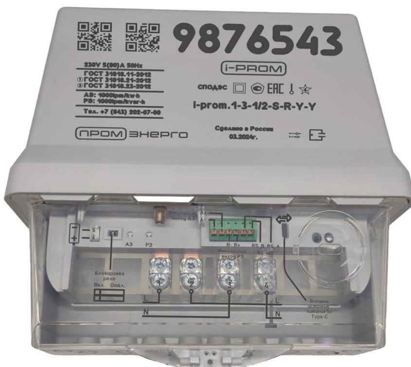
Рисунок 2 – Общий вид счетчиков электрической энергии однофазных многофункциональных i-prom.1 в корпусе S – Split