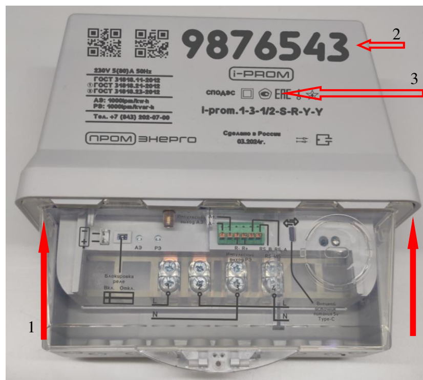
Рисунок 4 – Схема пломбировки от несанкционированного доступа (1), место нанесения заводских номеров (2) и место нанесения знака утверждения типа (3) на счетчике i-prom.1 в корпусе S – Split