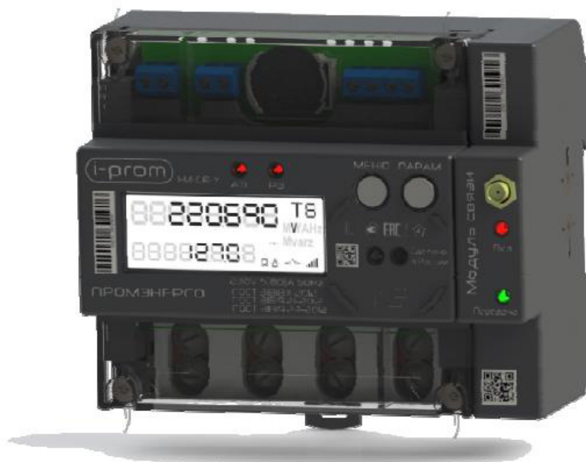
Рисунок 1 – Общий вид счетчиков электрической энергии однофазных многофункциональных i-prom.1 в корпусе М – МКД

Схема пломбировки от несанкционированного доступа, обозначение мест нанесения заводского номера и знака утверждения типа представлены на рисунках 3 и 4.