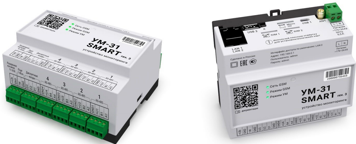
Рисунок 2 – Внешний вид УМ

На корпусе УМ расположены разъёмные соединители, индикаторы и кнопки, расположение которых приведено на рисунке 3.